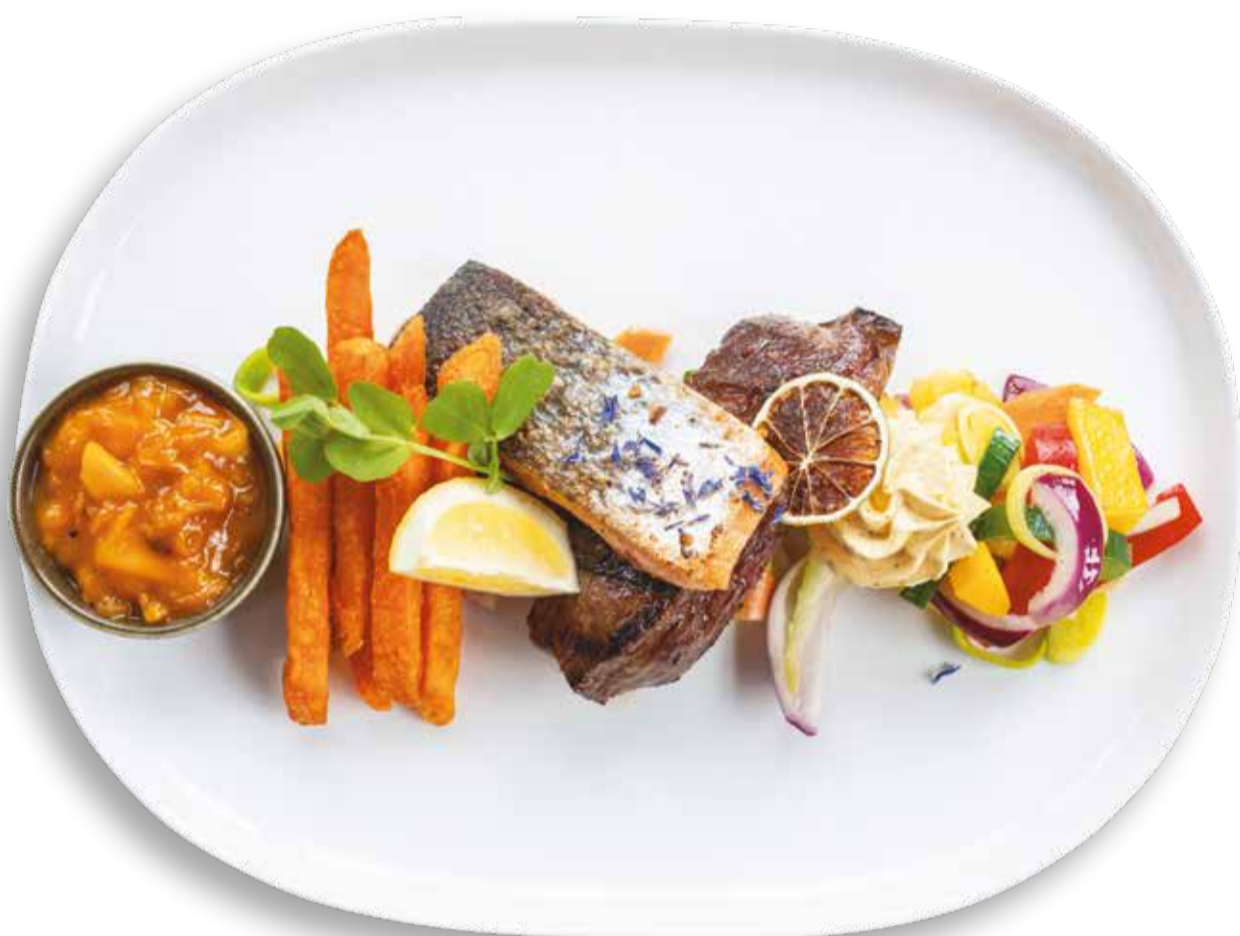
STEAK & FISCH

mit Blattspinat, Parmesan-Polenta und Café de Paris